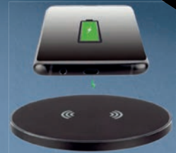
Wireless Charger 15W, schwarz, Ladepad für schnelles kabelloses Laden

Sie erhalten 10% Aktionsrabatt und zu jeder Box kostenlos einen Wireless Charger 15W